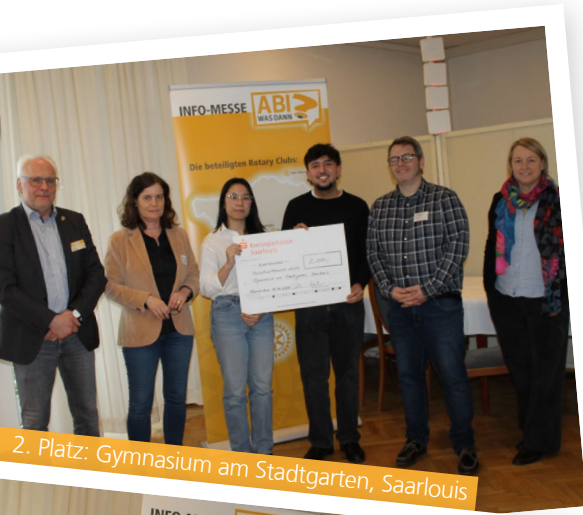
2. Platz: Gymnasium am Stadtgarten, Saarlouis