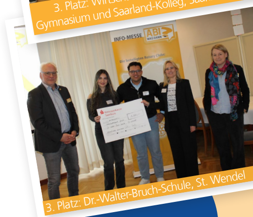
3. Platz: Dr.-Walter-Bruch-Schule, St. Wendel

Die „Messe Abi – was dann?“ ist eine Initiative von saarländischen und einigen rheinland-pfälzischen Rotary Clubs und ist für angehende Abiturienten gedacht. Sie findet seit 2003 erfolgreich statt. Im Messe-Jahr 2024 hatte die saarländische Ministerpräsidentin Anke Rehlinger die Schirmherrschaft inne. Die nächste Messe findet im September 2026 in der Congresshalle Saarbrücken statt.