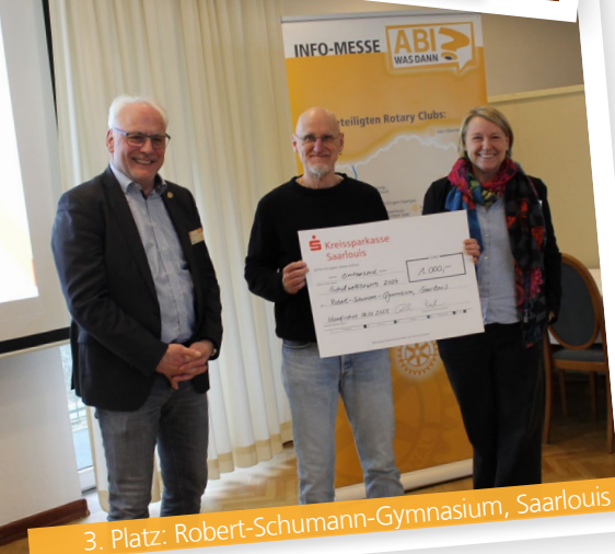
3. Platz: Robert-Schumann-Gymnasium, Saarlouis