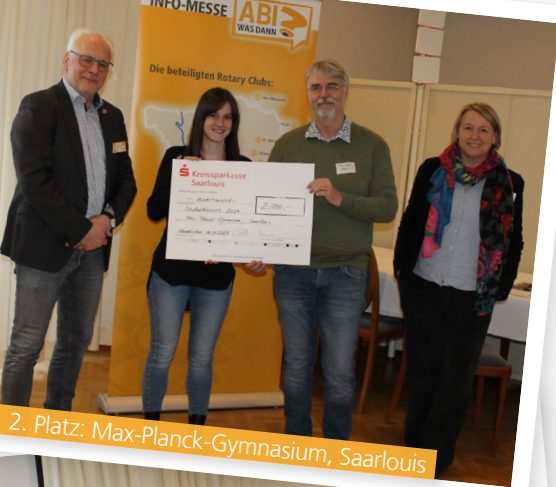
2. Platz: Max-Planck-Gymnasium, Saarlouis