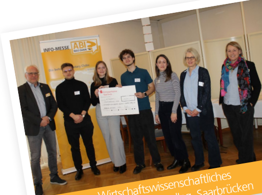
3. Platz: Wirtschaftswissenschaftliches Gymnasium und Saarland-Kolleg, Saarbrücken